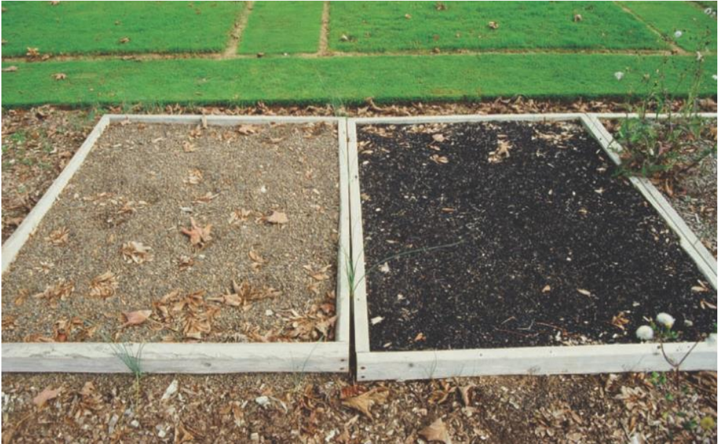
شکل ۱۰-۱۰ گراول و آکاستیو بر فراز پارچه ضد علف‌هرز، یک مانع کنترل‌کننده بسیار عالی برای علف‌هرز تا چند سال پس از استقرار ایجاد می‌نماید. با تجمع ضایعات در گراول، بذور علف‌هرز به تدریج در خاکپوش گراول نیز رشد می‌نماید.