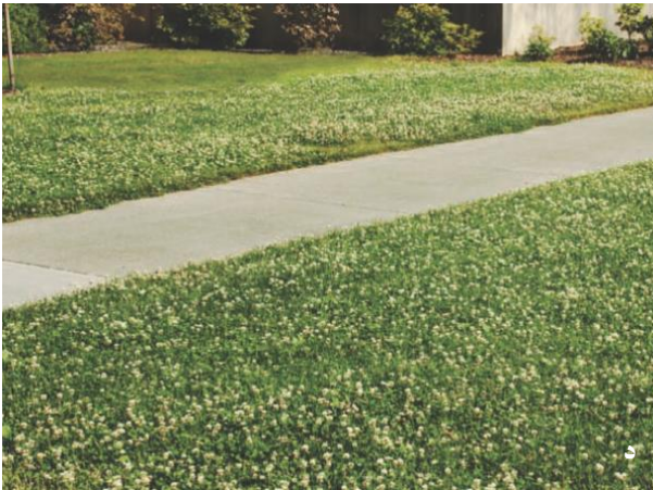
شکل ۹-۳ گیاهان مناسب زیادی برای مخلوط گراس-دولپه‌ای وجود دارند. (الف) آلاله ( Ranunculus spp. ) و مینا ( spp. Bellis ) در چمن. (ب) سیزاب ( Veronica spp. ) با گل‌های آبی و جذاب. (ج) گالیم ( Galium verum ) از دور بسیار شبیه به گراس چمنی به نظر می‌رسد. (د) شبدر ( Trifolium spp. ) جذاب بوده و نیتروژن جو را تثبیت می‌نماید.