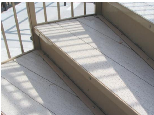
شکل ۳-۳ برای ساخت این پله‌ها از چوب کامپوزیت استفاده شده است. این محصول شبیه چوب است ولی عمر طولانی‌تری دارد و نیازمند نگهداری کمتری نسبت به چوب است.