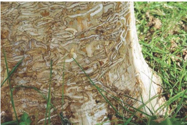
شکل ۲-۵ شیارهای به جا مانده از حاشیه خوار شاهی ( Agrilus planipennis ) مبنی بر آرزین بردن درخت توسط این حشره است. این حشره زیر پوست قرار دارد و بافت آوندی درخت را تخریب کرده و سبب مرگ ناگهانی آن می شود؛ دانشگاه ایالت آیوا.