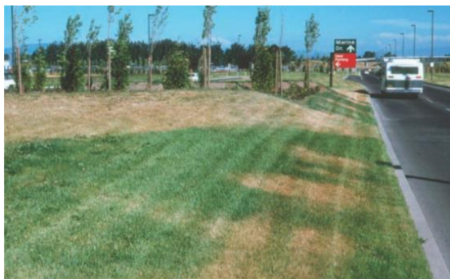
شکل ۱-۲ تنظیم ضعیف سیستم آبیاری، براساس تنوع و تغییر در رنگ چمن نمایان می‌گردد. مناطق تیره‌تر، آب کافی دریافت نموده‌اند درحالی‌که دایره‌های روشن‌تر آب کافی دریافت نکرده‌اند.