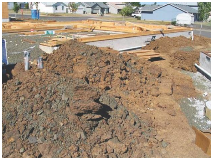
شکل ۱-۳ خاک زیرسطحی با کیفیت پایین اغلب به صورت لایه‌ای بر فراز خاک رویین با منشأ اصلی قرار گرفته، و محیط ریشه‌زایی ضعیفی برای گیاهان تازه استقرار یافته ایجاد می‌نماید.