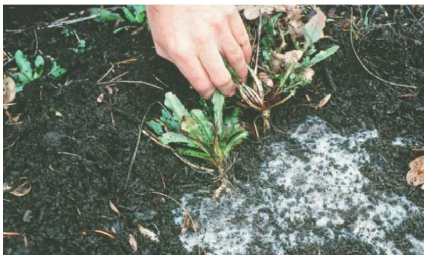
شکل ۱۰-۹ علف‌های هرز ممکن است از روی خاکپوش نفوذ نمایند و در درون خاک زیرین رشد یابند که این امر مزیت استفاده از پارچه‌های ضد علف هرز را نفی می‌نماید.