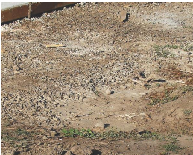
شکل ۲-۳ خاک‌های فشرده ساختار خود را از دست داده و ذرات درشت به سمت سطح منتقل شده و منجر به شکاف سطحی و کاهش نفوذ خواهند شد.