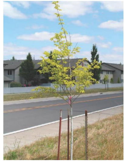
شکل ۸-۳ (الف) خزان زودهنگام در درخت تغذیه نشده (ب) خزان تأخیریافته در درخت تغذیه شده.

شکل ۸-۲ درختان کاشته شده به صورت نشایی اغلب به مدت چند سال به دلیل کمبود نیتروژن با مشکل مواجه شده‌اند و رشد و نمو سریع ندارند.