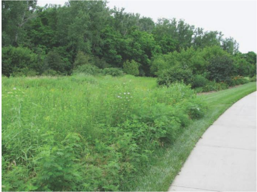
شکل ۳-۴ منطقه‌ای که روزی چمنکاری وسیعی بوده اکنون تبدیل به یک منطقه کشت گیاهان بومی شده است. این فضا هم‌اکنون منعکس‌کننده منظر نیمه غربی منطقه‌ای است. تصویر از سونگ در باغ‌هاب لوریتزن، نبراسکا.