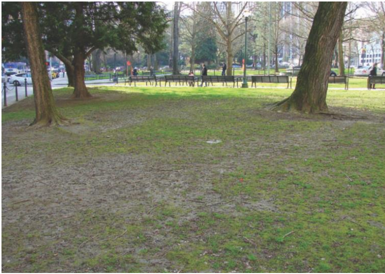
شکل ۲-۵ یکی از نتایج رشد و بلوغ درختان این است که منطقه سایه‌انداز آنها گسترده شده و چمن‌های کاشته شده در زیر این منطقه برای بقا با مشکل مواجهند.