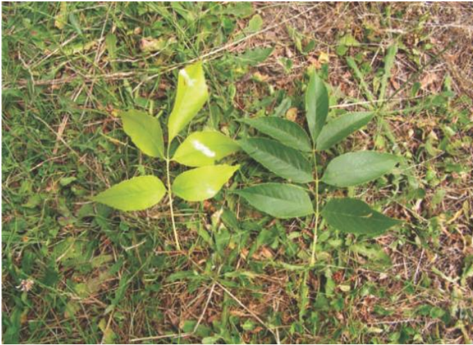
شکل ۸-۴ درختان با رشد محدود به طور طبیعی یک فلش رشدی در هر سال رشد ایجاد می‌کنند. در این نمونه، افزایش رنگ (برگ‌های سمت راست) در سال اول کاربرد کود در مقایسه با عدم کوددهی مشاهده می‌شود.

شکل ۸-۲ درختان کاشته شده به صورت نشایی اغلب به مدت چند سال به دلیل کمبود نیتروژن با مشکل مواجه شده‌اند و رشد و نمو سریع ندارند.