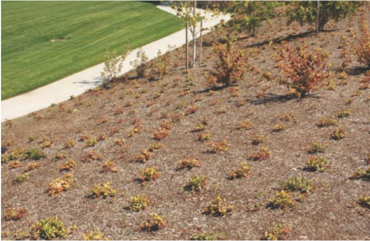
شکل ۲-۳ گیاهان پوششی کشت شده بر روی این شیب، جایگزین خوبی برای چمن هستند و پس از استقرار، گیاهان جذابی برای منظر خواهند بود.