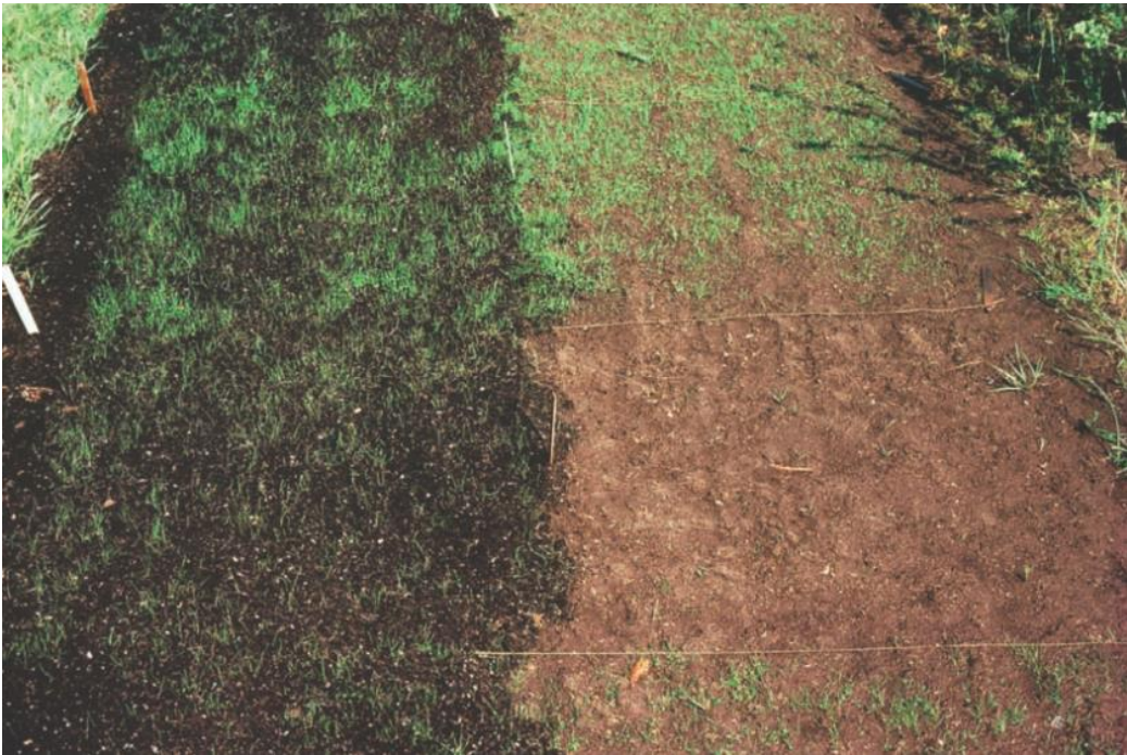
شکل ۱۰-۱۱ در بخش زیرین این تصویر، فعالیت اکسیداسیونی با قراردادن خاکپوش روی آن پس از استفاده حذف شده است (چپ). اکسیداسیون روی خاک بدون پوشش بسیار فعال است (راست).