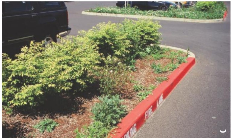
شکل ۱۰-۷ (الف) توقف استفاده از علف‌کش روی بسترهای معمول، منجر به حضور شدید علف‌های هرز خواهد شد. (ب) کشت جدید در معرض حمله علف هرز قرار دارد.