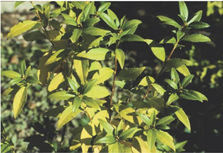
شکل ۲-۴ اسیدپته قلیایی خاک در این مکان منجر به ایجاد گیاهان کلروزه (با برگساره زرد) شده است.