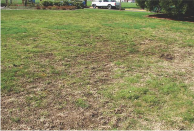
شکل ۱۰-۶ خسارت کرن‌فلای اروپایی در بهار قابل مشاهده بوده و به‌طور معمول مطابق تصویر به‌صورت تنک‌شدن متوسط تا شدید نمایان می‌گردد.