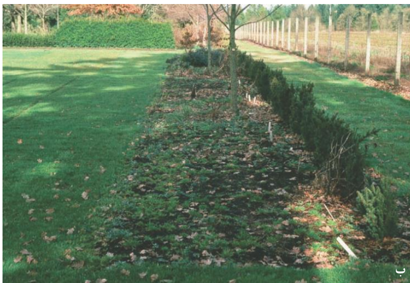
شکل ۱۰-۸ (الف) یک بستر با ژئوتکستایل پارچه‌ای پوشیده شده با ۳ اینچ (۷/۵ سانتیمتر) خاکپوش. (ب) علف‌های هرز یکساله زمستانه در خاکپوش جوانه زده و منجر به حمله شدید علف هرز در اوایل بهار خواهد شد.